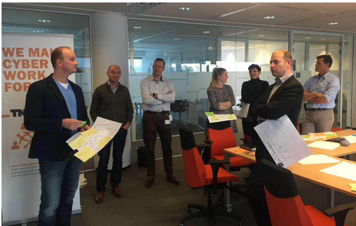
15 januari 2015, TNO/HSD: presentatie met onder meer de Duitse partner.